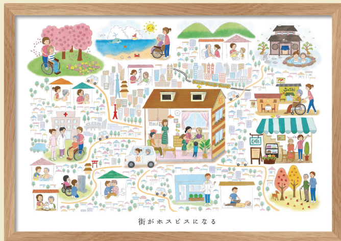
街がホスピスになる