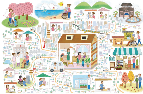
街がホスピスになる