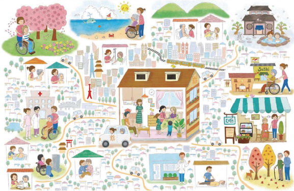
街がホスピスになる