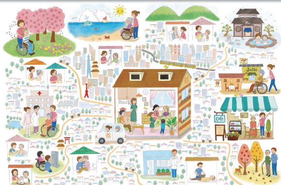
街がホスピスになる