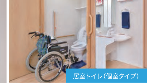
居室トイレ (個室タイプ)