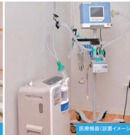
医療機器(設置イメージ)