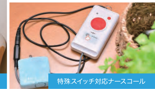
特殊スイッチ対応ナースコール