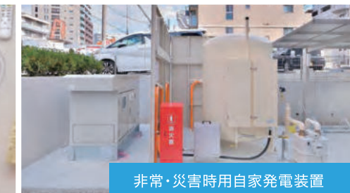
非常・災害時用自家発電装置