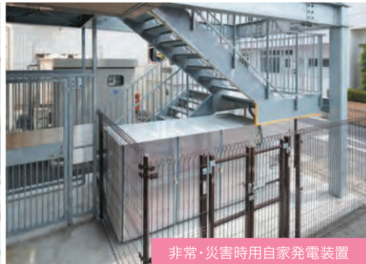
非常・災害時用自家発電装置