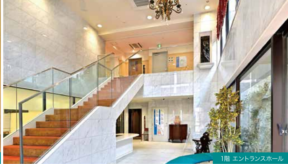
1階 エントランスホール