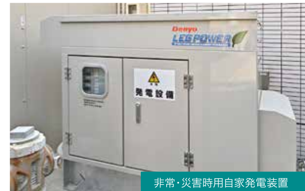
非常・災害時用自家発電装置