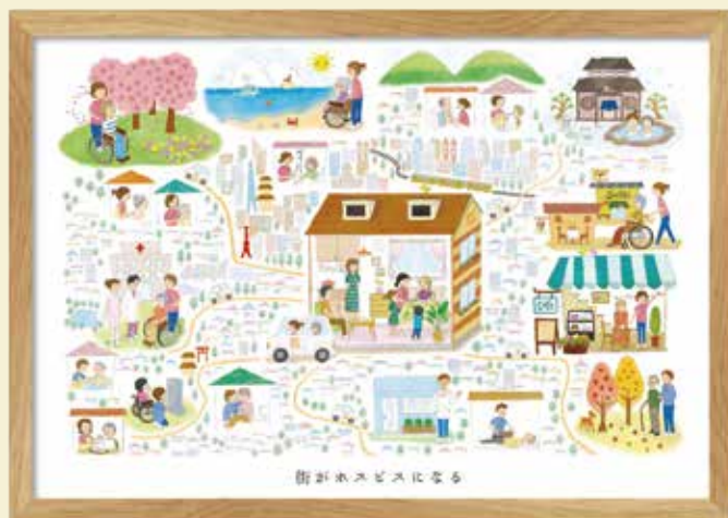
街がホスピスになる